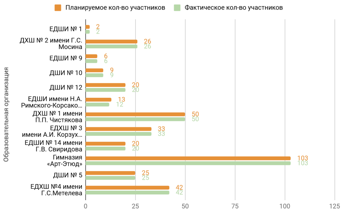
Диаграмма «Количество участников мониторинга»