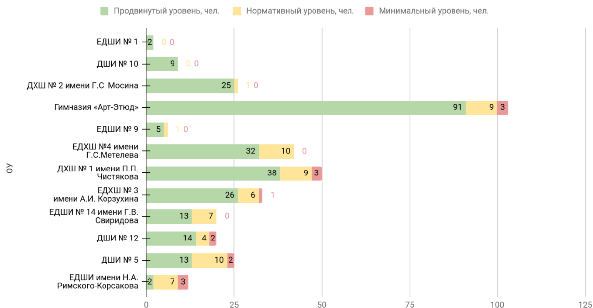
Диаграмма «Уровень по школам, чел.»