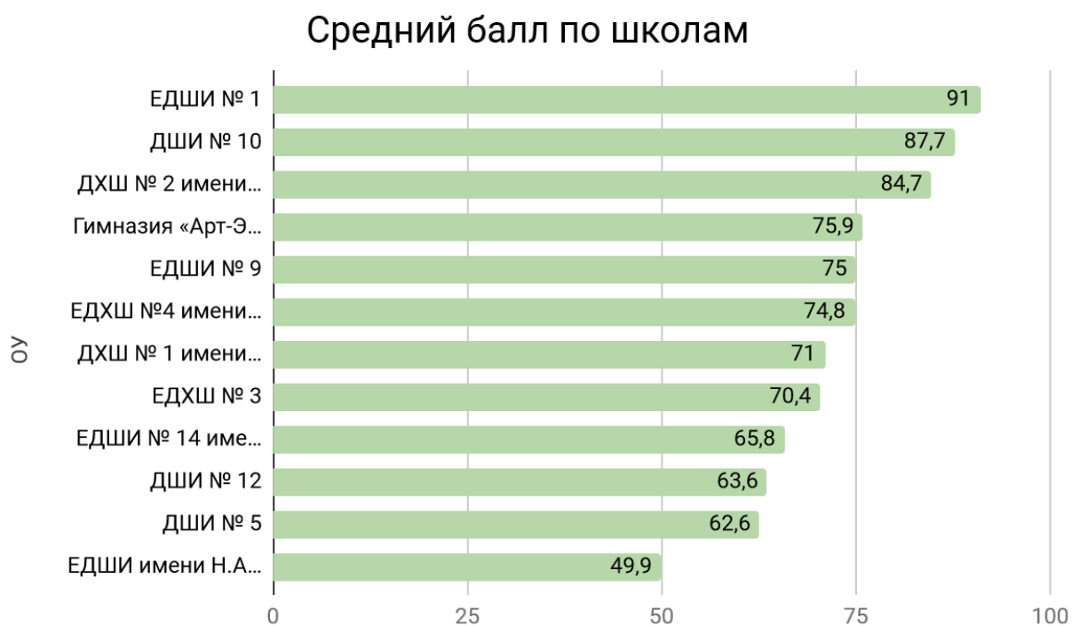
Диаграмма «Средний балл по школам»