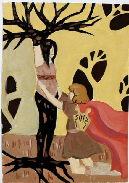
Цвиткис Дина Иллюстрации к мифам Древней Греции Гуашь