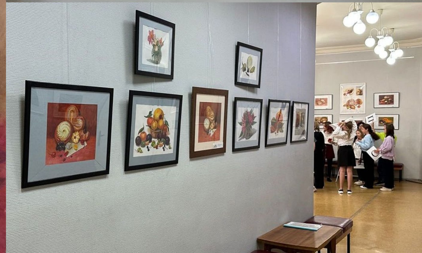
Методическая выставка работ преподавателей детских школ искусств Екатеринбурга «МИР АКВАРЕЛИ»